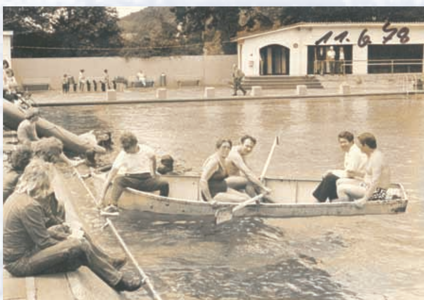
Die legendären schrägen Wände (1978)