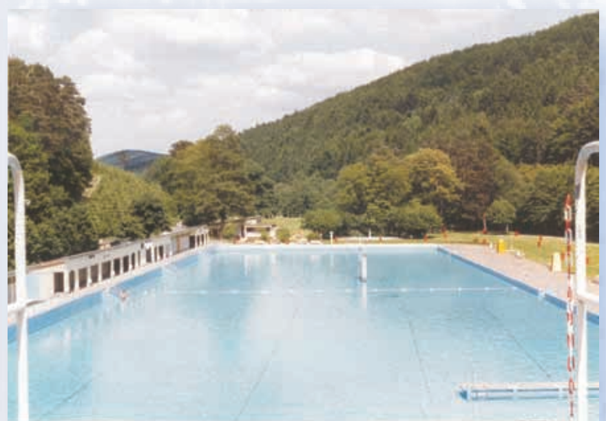
Noch ganz in weiß (1986)