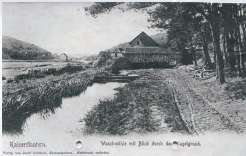
Die Waschmühle um 1900